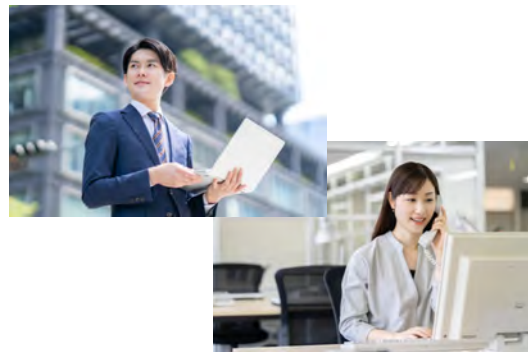
撮影同行・ディレクション